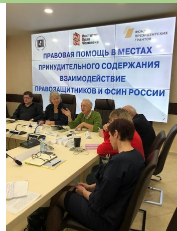
Круглый стол «Правовая помощь в местах принудительного содержания: взаимодействие правозащитников и ФСИН России». 10 октября 2019 г.

В октябре организован и проведен круглый стол «Правовая помощь в местах принудительного содержания: взаимодействие правозащитников и ФСИН России». Круглый стол прошел 10 октября в Доме общественных организаций по адресу ул. Покровка, 5. В нем приняли участие 23 человека, в том числе представитель уполномоченного по правам человека в Московской области, 7 региональных участников. С материалами круглого стола (тезисы участников, фотоматериалы) можно ознакомиться на сайте "Тюрьма и воля"