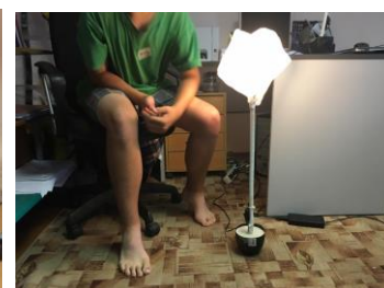
Занятие по созданию осветительного прибора.