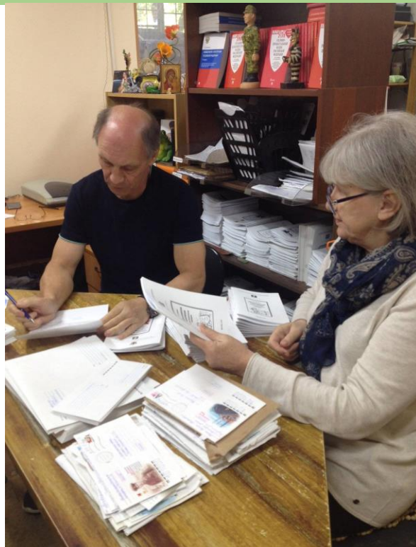
Работа с письмами осужденных. Подготовка информационно-правовых материалов для ответов обратившихся.

Кроме того, изданные брошюры были высланы по индивидуальным запросам заключенных и их родственников в дополнение к оказанным правовым консультациям, а также в библиотеки 71 учреждения ФСИН России, где они доступны для дальнейшего пользования большим числом заключенных в целях самостоятельной подготовки к обжалованию приговора и защиты своих прав.