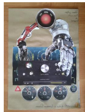
Мастер-класс по дизайну и робототехнике.