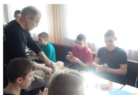
Развивающие игры «Трансплантация сердца» и «Игра на овощах».