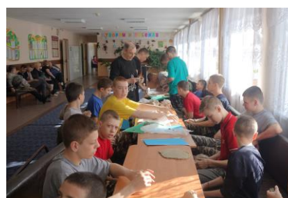
Занятия по медиации и разрешению конфликтных ситуаций