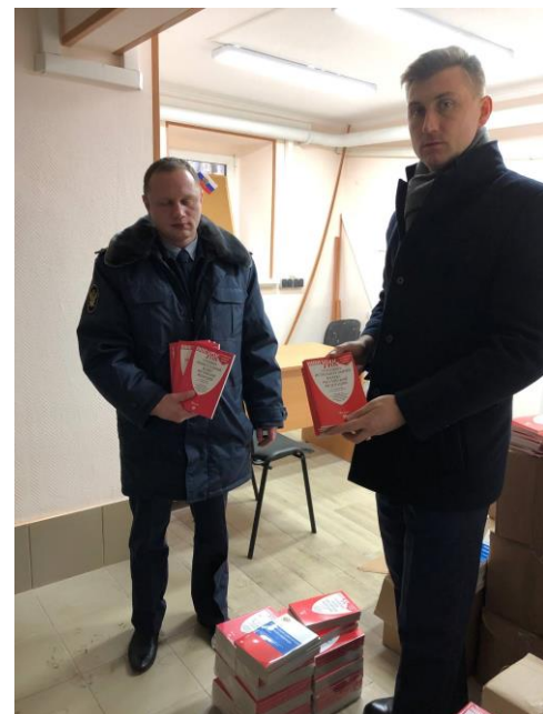
Передача брошюр и кодексов в СИЗО сотрудникам СИЗО г. Москвы.