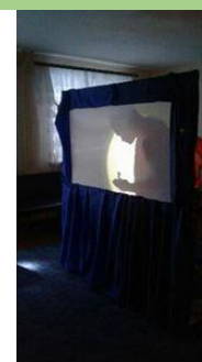
Теневой спектакль «Новогодняя сказка».